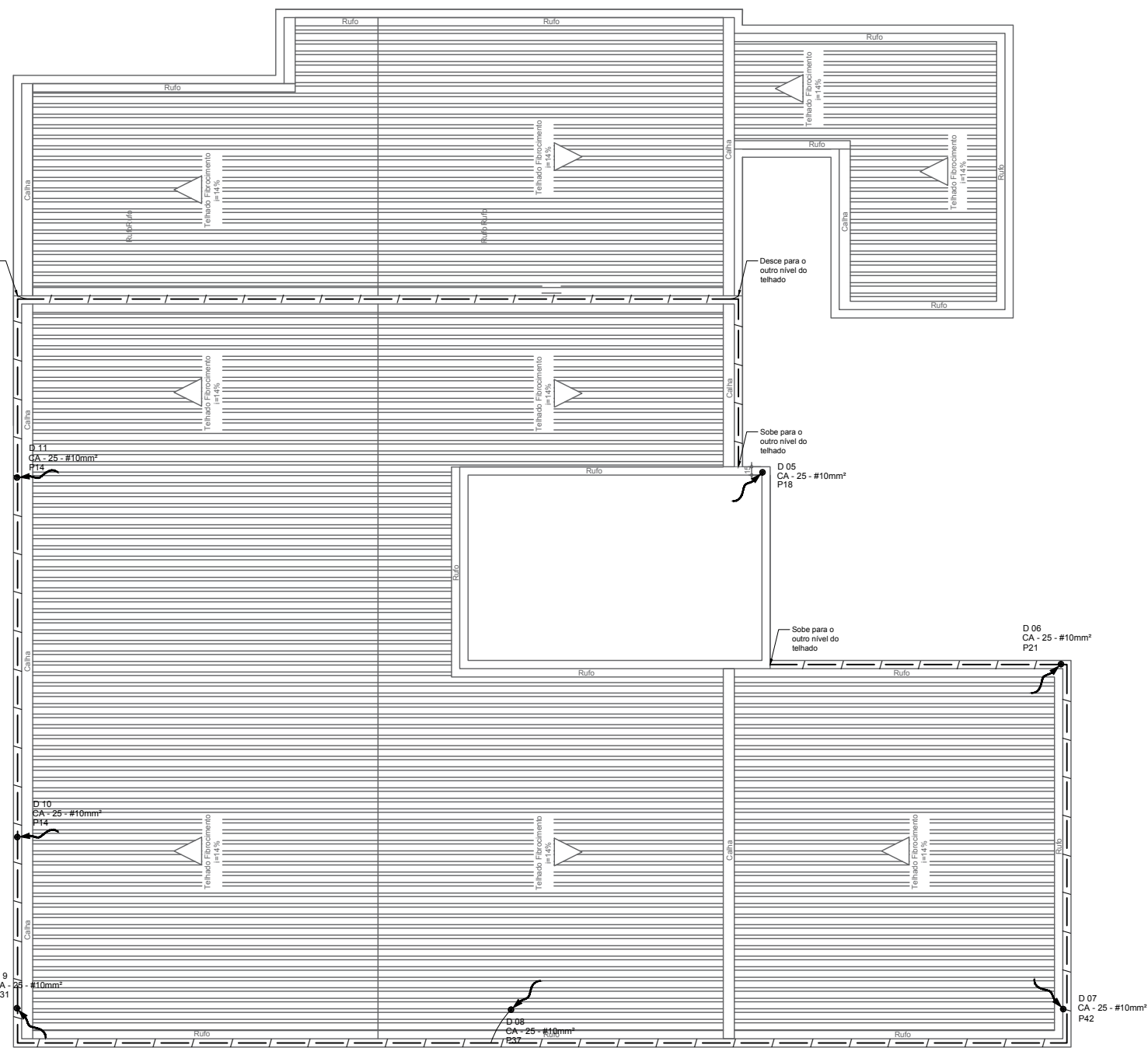
3 PLANTA DO ATICO - PRUMADAS - SPDA E CAMINHAMENTO DOS CABOS ESCALA: 1:100

OBSERVAÇÃO VALOR OHMICO DO ATERRAMENTO: - APÓS A EXECUÇÃO DA INSTALAÇÃO CONFORME ESTE PROJETO TODOS OS SISTEMAS DE ATERRAMENTO DEVERÃO TER SUA RESISTÊNCIA MEDIDA. SE O VALOR MEDIDO ULTRAPASSAR 10 OHMS, ACRESCENTAR ELETRODOS ATÉ ATINGIR ESTE VALOR. PODERÁ TAMBÉM SER USADO ATERRAGEL OU SIMILAR. - A RESISTÊNCIA DA CONTINUIDADE ELÉTRICA DAS ARMADURAS DO SISTEMA DEVE SER INFERIOR A 1 OHM. - ALÉM DOS NEUTROS DEVERÃO SER LIGADOS AOS FIOS TERRA TODAS AS PARTES METÁLICAS NÃO ENERGIZADAS. NOTAS - A PROFUNDIDADE MÍNIMA PARA MALHA DE ATERRAMENTO É DE 50 CM. - AS MALHAS DE ATERRAMENTO DOS SISTEMAS ELÉTRICOS E PROTEÇÃO ATMOSFÉRICA DEVERÃO SER INTERLIGADOS, FORMANDO APENAS UM SISTEMA. REFERÊNCIAS - MEMORIAL DESCRITIVO E ESPECIFICAÇÕES TÉCNICAS. - PLANILHA DE QUANTITATIVOS.